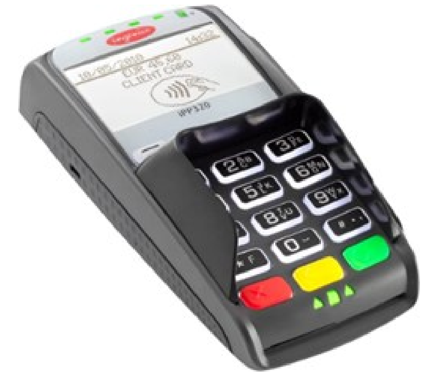
Терминал для оплаты банковской картой